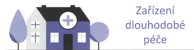
Zařízení dlouhodobé péče