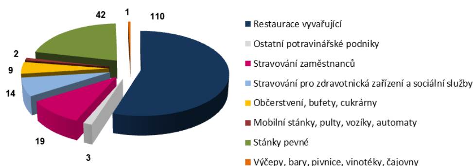
Počet kontrol dle typu provozovny za 1. čtvrtletí 2017 v Libereckém kraji

Ve sledovaném období byl 3x uložen zákaz používání nejakostní pitné vody. Za zjištěné nedostatky bylo uloženo 20 pokut v celkové výši 84 000,- Kč .