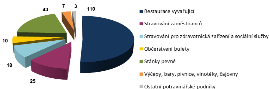
Počet kontrol dle typu provozovny za 1. čtvrtletí 2016 v Libereckém kraji

V třech případech bylo odstranění nedostatků uloženo formou vymahatelného opatření, konkrétně nařízení znehodnocení nebo likvidace potravin - 1x, 2x zákaz používání nejakostní pitné vody . Za zjištěné nedostatky bylo v první čtvrtině roku v LK uloženo 22 pokut v celkové výši 88 000,- Kč .