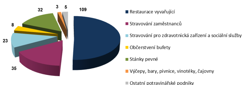
Počet kontrol dle typu provozovny za 2. čtvrtletí 2016 v Libereckém kraji

V šesti případech bylo odstranění nedostatků uloženo formou vymahatelného opatření, konkrétně nařízení znehodnocení nebo likvidace potravin - 4x, 1x zákaz používání nejakostní pitné vody a 1x okamžité uzavření provozovny do doby uvedení provozovny do nezávadného stavu . Za zjištěné nedostatky bylo v uvedeném období uloženo 21 pokut v celkové výši 96 000,- Kč .