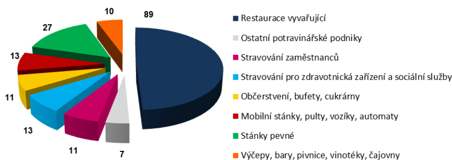
Počet kontrol dle typu provozovny za 2. čtvrtletí 2017 v Libereckém kraji

Za zjištěné nedostatky bylo uloženo 19 pokut v celkové výši 87 000,- Kč . Dále ve sledovaném období byla 1x uložena likvidace potravin.