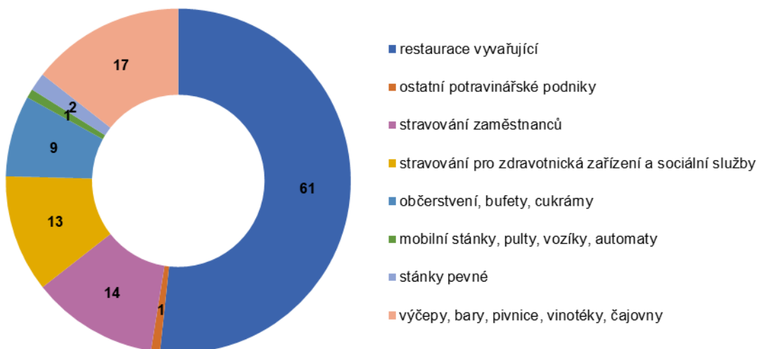
Počet kontrol dle typu provozovny za 4. čtvrtletí 2022 v Libereckém kraji

V posledním čtvrtletí loňského roku provedli zaměstnanci KHS LK celkem 118 kontrol v provozovnách společného stravování. Za zjištěné nedostatky uložili 18 pokut v celkové výši 67 500,- Kč. Jednou nařídili likvidaci potravin/pokrmů.